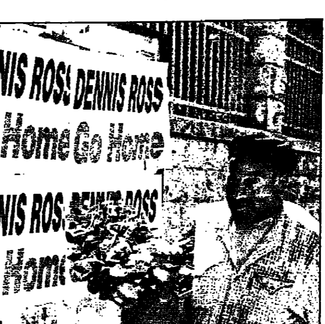
بالغ (غير يبر من امام لائحة المسترطين دعم البعث الامريكي دنيس روس للعودة الي بلاده

وتكررت المحاصر الفلسطينية ان الفلسطينيين تسلمهم بعيدا الجناح الذي استندت اليه المذكور وباعتماد ان الفلسطينيين والاسرائيليين يتحسححان عسكريين متساويين في مكافحة القوي التي تريد تدمير العملية السلمية من الجناحين.